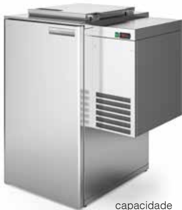
capacidade capacity 240L