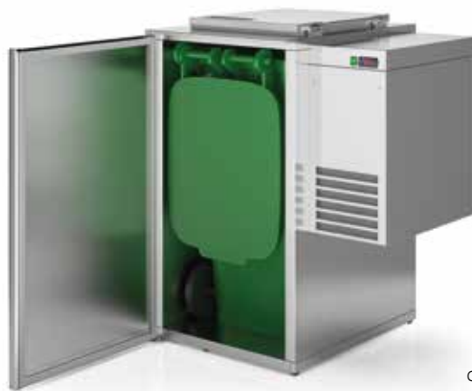
capacidade capacity 480L